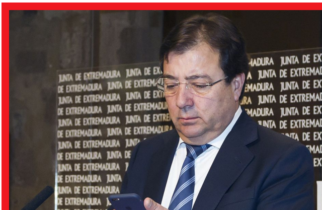
El presidente de la Junta de Extremadura, el socialista Guillermo Fernández Vara

El presidente de la Junta de Extremadura, Guillermo Fernández Vara, ha destacado este pasado lunes la importancia de apostar por el mestizaje cultural para seguir construyendo Europa. El mandatario extremeño ha hecho estas declaraciones en Lisboa, donde ha asistido a la presentación de la 63 edición del Festival Internacional de Teatro Clásico de Mérida. Fernández Vara ha insistido en la oportunidad que supone la celebración de este