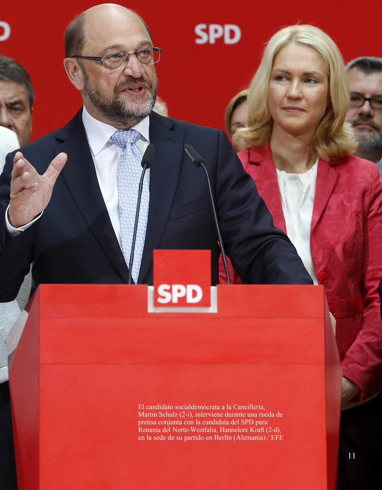
El candidato socialdemócrata a la Cancillería, Martin Schulz (2-i), interviene durante una rueda de prensa conjunta con la candidata del SPD para Renania del Norte-Westfalia, Hannelore Kraft (2-d), en la sede de su partido en Berlín (Alemania)