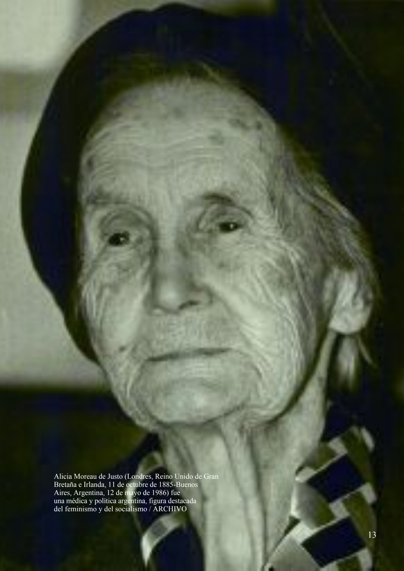
Alicia Moreau de Justo (Londres, Reino Unido de Gran Bretaña e Irlanda, 11 de octubre de 1885-Buenos Aires, Argentina, 12 de mayo de 1986) fue una médica y política argentina, figura destacada del feminismo y del socialismo