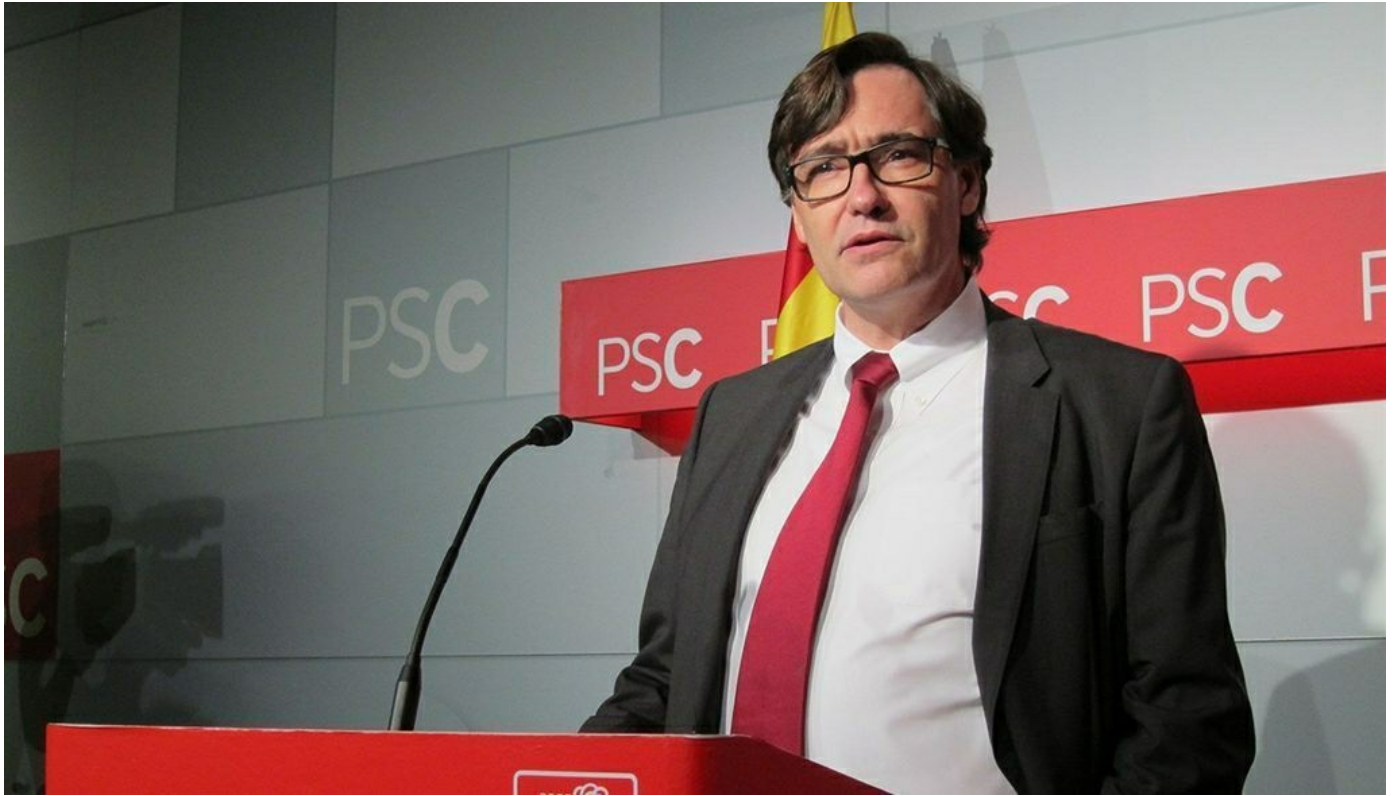
El secretario de Organización del PSC, Salvador Illa

CATALUNYA / El secretari d'Organització del PSC, Salvador Illa, ha valorat la firma de l'acord sobre la Renda Garantida de Ciutadania i ha afirmat que "és un acord que celebrem tot i que arriba tard. Des de 2012 hi havia un clam d'entitats socials, sindicats i alguns partits polítics com el nostre per implantar un model social basat en la garantia de rendes. Però ara és moment per a congratular-nos de l'acord". Segons Salvador Illa, "celebrem especialment que s'hagi incorporat a l'acord allò que els i les socialistes reclamàvem: plans d'inclusió social i laboral per aquells que reben la Renda Garantida. Perquè l'objectiu fonamental és que puguin deixar de rebre-la, ja que això voldrà dir que han estat capaços d'allunyar-se de l'exclusió per encetar el camí de la inclusió".